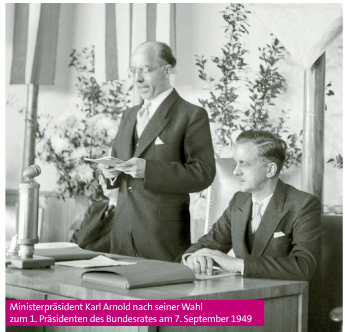
Ministerpräsident Karl Arnold nach seiner Wahl zum 1. Präsidenten des Bundesrates am 7. September 1949

In diesen Ämtern hat Karl Arnold beim Aufbau der Bundes-