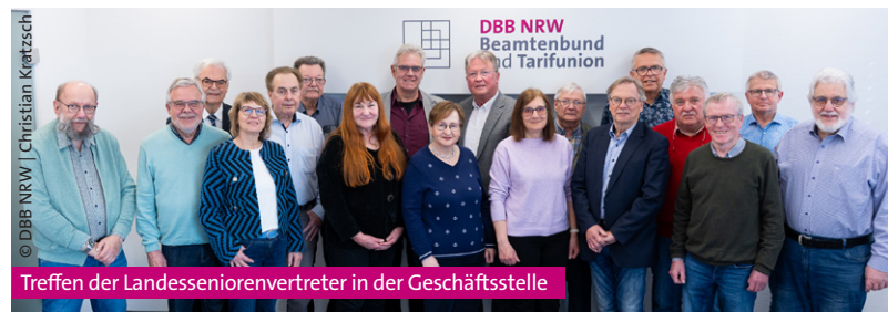
Treffen der Landesseniorenvertreter in der Geschäftsstelle

den regen Austausch und das große Engagement! MM