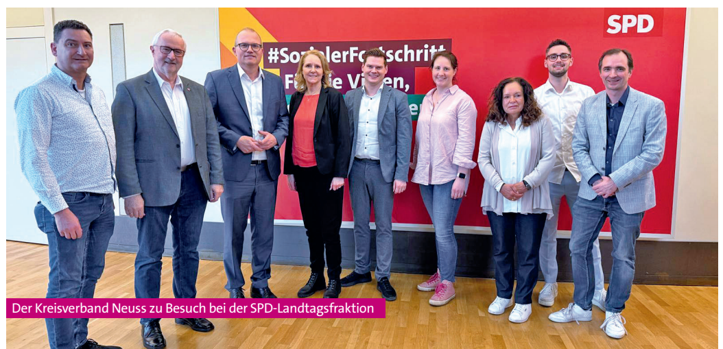
Der Kreisverband Neuss zu Besuch bei der SPD-Landtagsfraktion