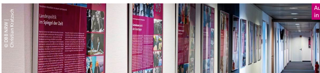
Ausstellung „Unser Land hat Geburtstag“ in der Landesgeschäftsstelle des DBB NRW

lung ist während der Geschäftszeiten kostenlos besuchbar, um eine Anmeldung wird gebeten. MM