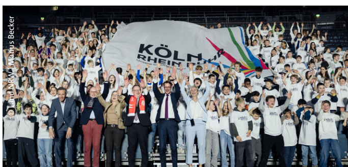
Start der Kampagne für die NRW-Bewerbung KölnRheinRuhr um Olympische und Paralympische Spiele im Januar in Köln