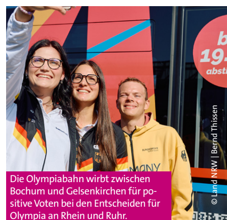
Die Olympiabahn wirbt zwischen Bochum und Gelsenkirchen für positive Voten bei den Entscheiden für Olympia an Rhein und Ruhr.