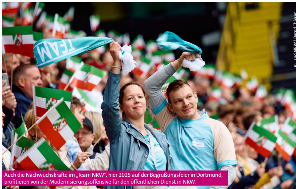
Auch die Nachwuchskräfte im „Team NRW“, hier 2025 auf der Begrüßungsfeier in Dortmund, profitieren von der Modernisierungsoffensive für den öffentlichen Dienst in NRW.

„Die Ausweitung der Arbeitszeitregelung sowie die Umsetzung von Co-Working- und Shared-Working-Angeboten im öffentlichen Dienst verbessern die Vereinbarkeit von Familie, Beruf und Karriere, woraus sich ein spürbarer Mehrwert für alle Beschäftigten ergibt.“