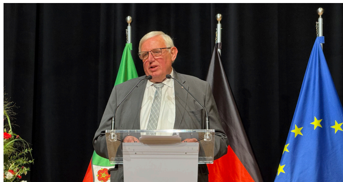
NRW-Arbeitsminister Karl-Josef Laumann auf dem Arbeitnehmerempfang der Landesregierung in Hagen.

Minister Laumann blendet in seiner Argumentation die neueste Rechtsprechung des Bundesverfassungsgerichts aus dem Jahr 2025 völlig aus. Es wäre verfassungsrechtlich mindestens bedenklich, wenn die zusätzlich anfallenden Beiträge zur Absicherung der Krankheitskosten aus der regulären Besoldung der Beamtinnen und Beamten geleistet werden müssten, da dies die (Mindest-) Besoldung schmälern würde. Die Besoldung müsste stattdessen, um verfassungsrechtliche Vorgaben zu erfüllen, um die jeweils zu leistenden zusätzlichen Beiträge erhöht werden. Denn um eine verfassungsgemäße Besoldung und Versorgung der Beamten weiterhin zu