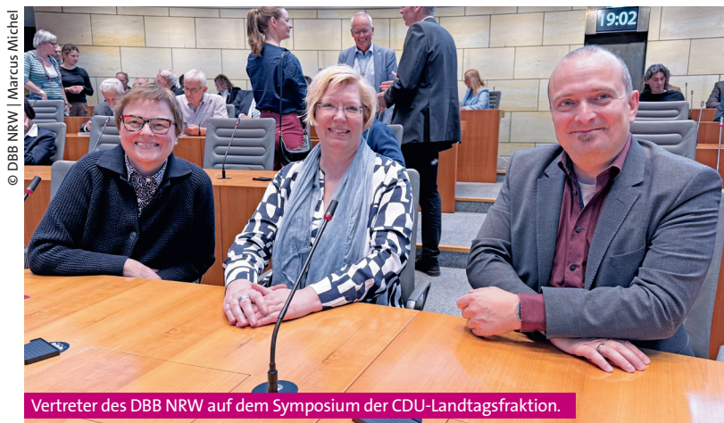
Vertreter des DBB NRW auf dem Symposium der CDU-Landtagsfraktion.

Grußworte sprachen Thorsten Schick , Vorsitzender der CDU-Landtagsfraktion, und Nathanael Liminski , NRW-Minister für Bundes- und Europaangele-