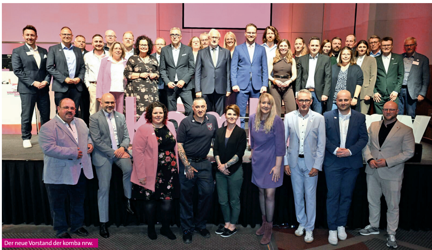
Der neue Vorstand der komba nrw.