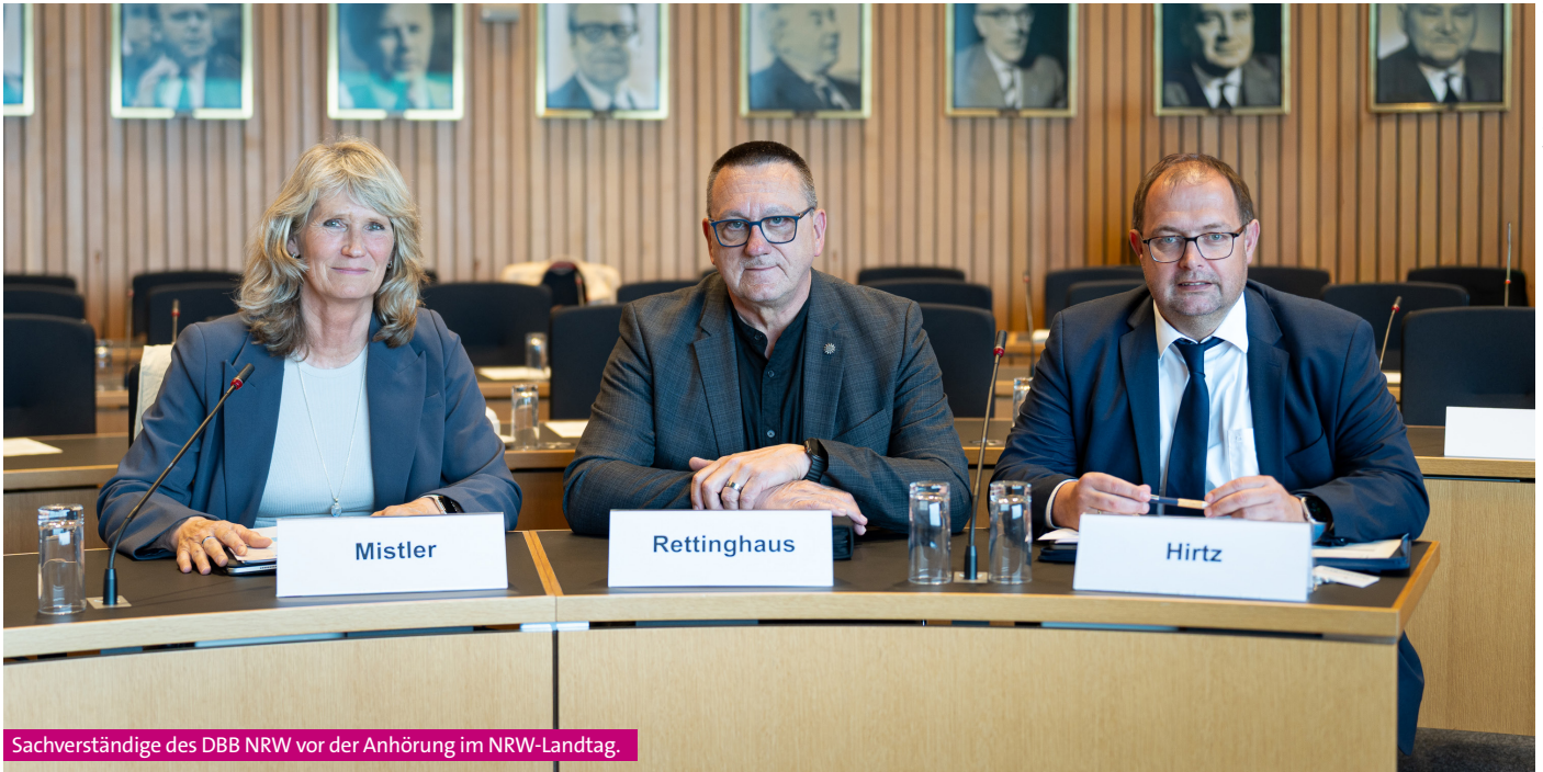
Sachverständige des DBB NRW vor der Anhörung im NRW-Landtag.