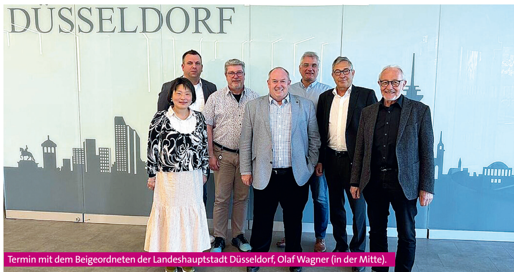
Termin mit dem Beigeordneten der Landeshauptstadt Düsseldorf, Olaf Wagner (in der Mitte).