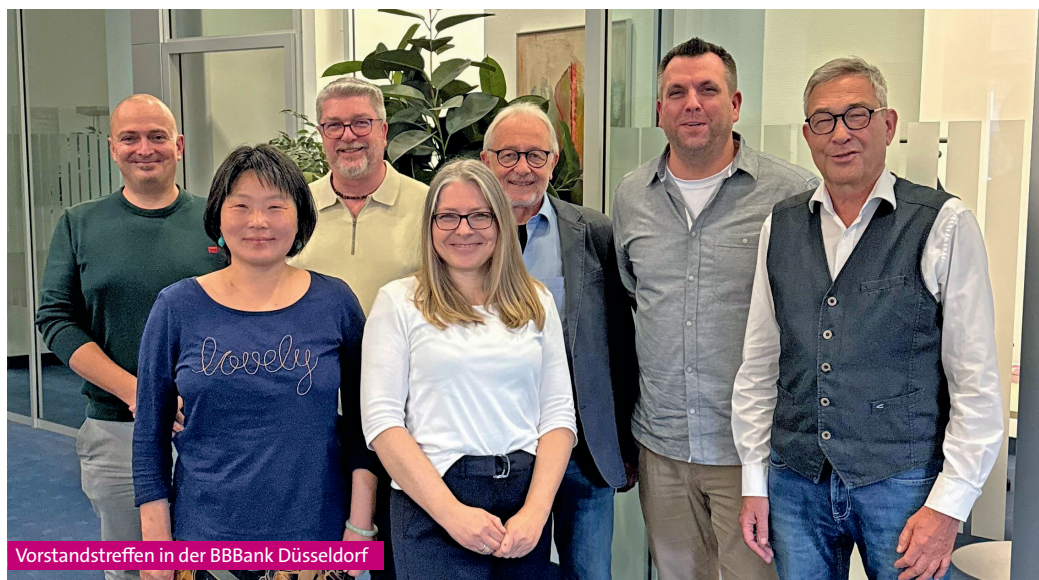
Vorstandstreffen in der BBBank Düsseldorf

empfang der Landeshauptstadt Düsseldorf anlässlich des Tags der Arbeit am 1. Mai vertreten und kam mit zahlreichen Vertretern aus Politik und Verwaltung ins Gespräch. MM