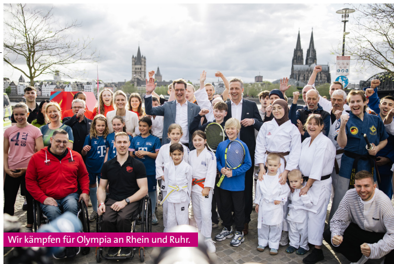
Wir kämpfen für Olympia an Rhein und Ruhr.