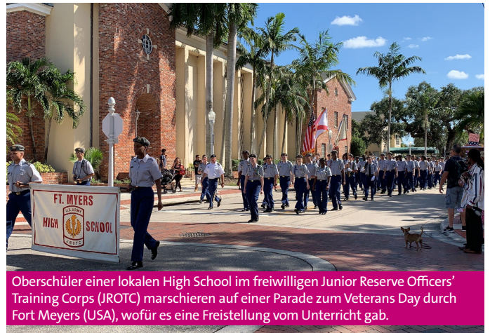
Oberschüler einer lokalen High School im freiwilligen Junior Reserve Officers' Training Corps (JROTC) marschieren auf einer Parade zum Veterans Day durch Fort Meyers (USA), wofür es eine Freistellung vom Unterricht gab.

Zuständig für die sogenannte Veteranenkultur der Bundeswehr ist das Anfang 2024 gegründete Veteranenbüro in Berlin. Laut der sehr allgemein gehaltenen Selbstbeschreibung auf dessen Webseite decken die Aufgabenbereiche jedoch schwerpunktmäßig nur die Interessenfelder von Einsatzveteranen ab, augenscheinlich gehört die (Rück-)Gewinnung früherer Wehrdienstleistender als wichtige Multiplikatoren und Reservisten nicht dazu. Auch in der Fläche leistet das Büro für Ausprägung und Gestaltung gelebter Veteranenkultur keine wahr-