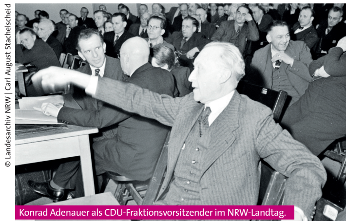
Konrad Adenauer als CDU-Fraktionsvorsitzender im NRW-Landtag.

Diese weitgehend übersehene landespolitische Zeit Adenauers ist ein wesentlicher Baustein seiner politischen Biografie – und zugleich ein Spiegel jener Generation, die Verantwortung übernahm, um parlamentarische Kultur neu zu begründen. MM