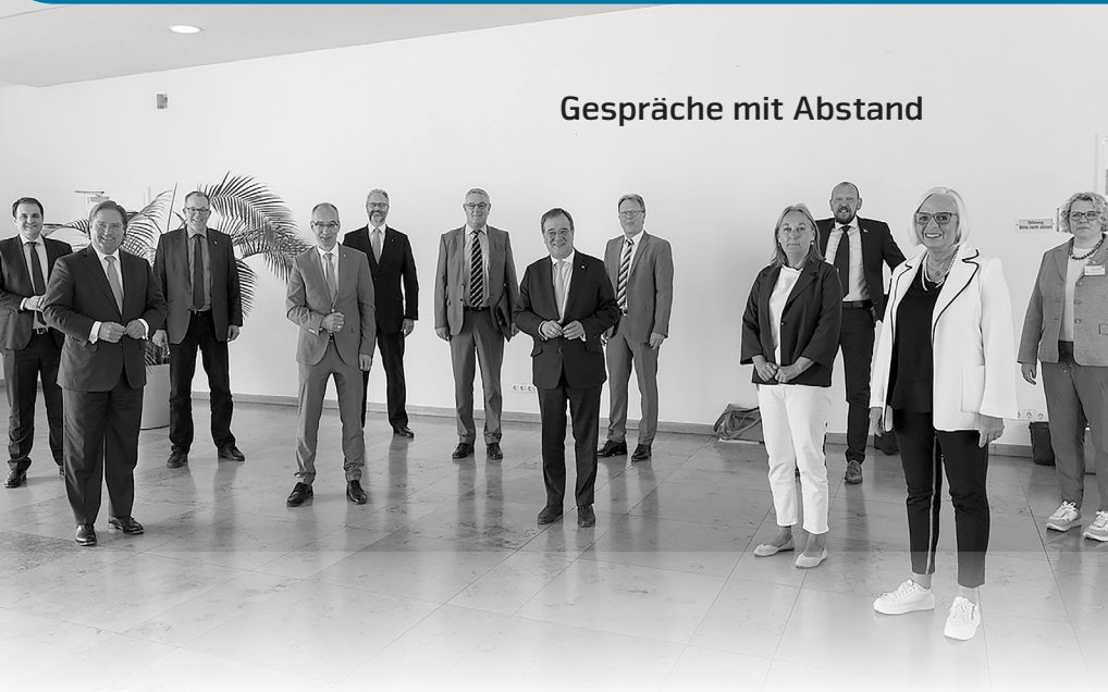
Gespräche mit Abstand